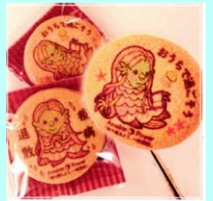
アマビエクッキー